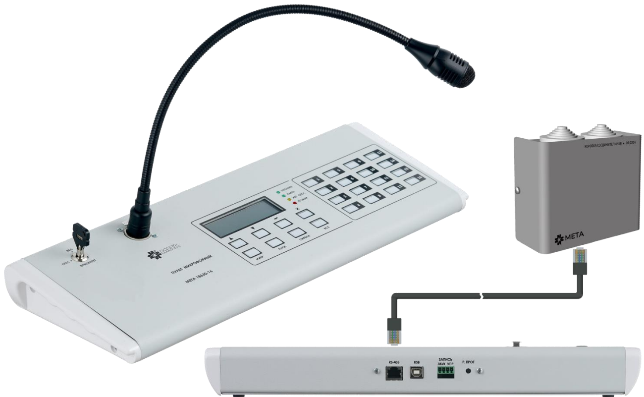
Рисунок 1. Внешний вид МП МЕТА 18630-16 и коробки соединительной DR-2204.