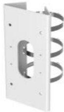
DS-1276ZJ-SUS Крепление на столб