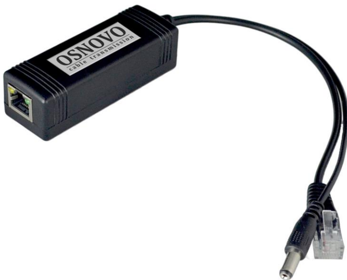
Рис.1 PoE Splitter/3, внешний вид